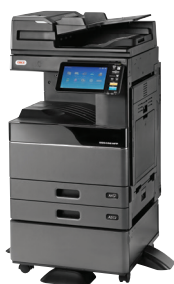
ES9466 MFP mit DSDf und Schrank