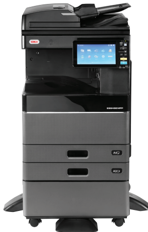
ES9466 MFP mit RADF und Schrank