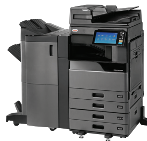
ES9466 MFP mit DSDf, PPF, Schubladenmodul, Broschüren-Finisher und Lochereinheit vorinstalliert